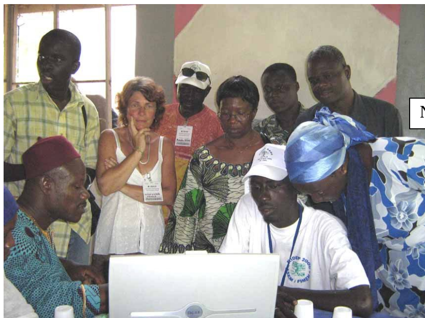
Nosso dia-a-dia era na Universidade.