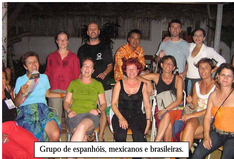
Grupo de espanhóis, mexicanos e brasileiras.