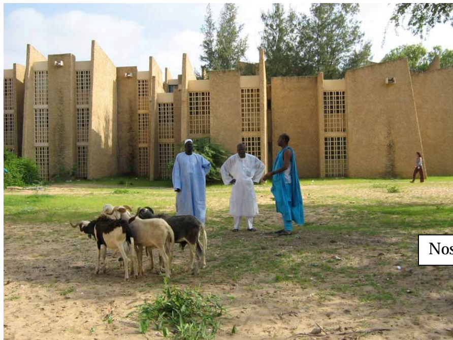
Nosso dia-a-dia era na Universidade.

No dia seguinte começaram os ateliês e abriu-se a possibilidade de aprofundar o diálogo e as trocas de experiências entre todos que participavam da RIDEF.