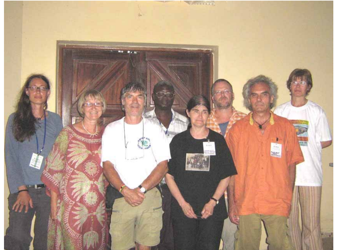
Membros do Conselho Administrativo da FIMEM

Foi promovida uma Mesa Redonda para discutir o problema da educação das meninas, no Senegal. Foi uma discussão muito importante, pois apesar dos esforços dos professores Freinet do Senegal, a questão cultural ainda determina uma segregação de gênero. O acesso à escola, ainda é muito difícil para as meninas, que têm que dar conta de muitos trabalhos domésticos.