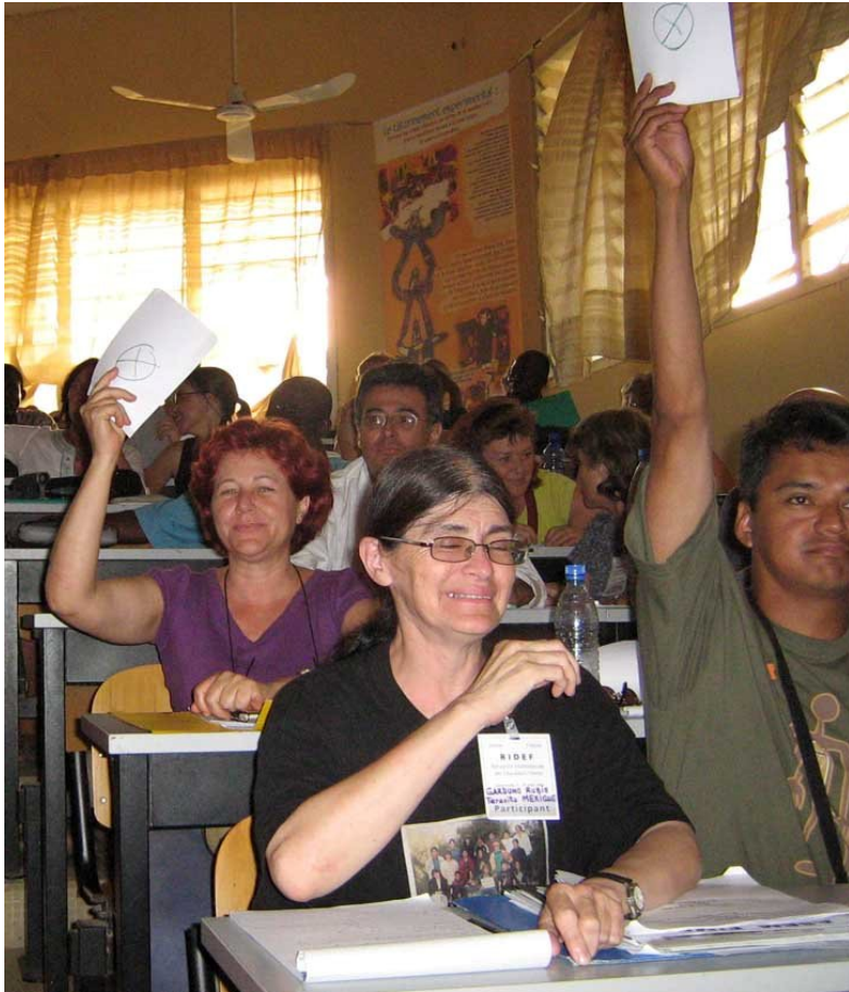
A votação no México como próximo país a sediar a RIDEF, em 2008

A Assembléia Geral da FIMEM tratou de uma importante discussão para definir o país sede da próxima RIDEF.